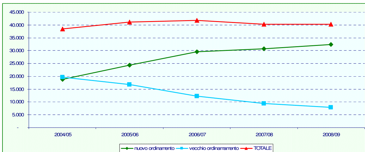
Grafico 1 – Iscritti ai corsi superiori secondo la tipologia di corso – a.a. 2008/2009 (serie storica a.a. 2004/05 – a.a. 2008/2009)

I nuovi ingressi nei corsi superiori (ossia gli iscritti al primo anno di tali corsi) costituiscono nel complesso circa il 23% del totale degli iscritti ai segmenti di istruzione superiore e, anche qui, in oltre l'80% dei casi si rileva una preferenza verso i corsi del nuovo ordinamento.